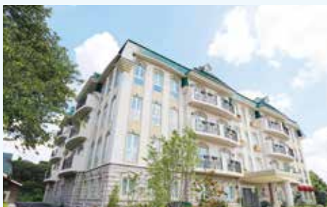
自立に向けた 集中的・実践的なリハビリテーション

一刻も早く集中的なリハビリテーションができる北原リハビリテーション病院に転院していただくために早期転院をご案内しています。