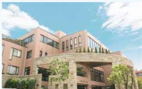
発症直後からの 超急性期リハビリテーション

急性期病院である北原国際病院では患者さまが出来るだけ良い状態で北原リハビリテーション病院へ転院できるように、医学的管理が必要な期間にお身体の機能が落ちないようにリハビリテーションを行います。