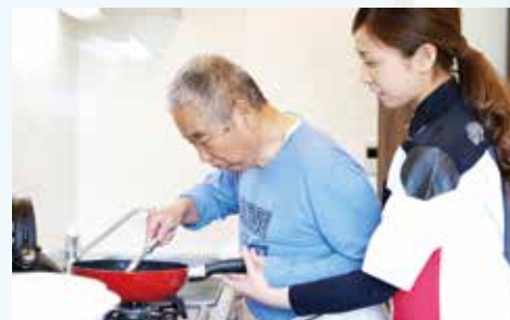
退院後に始まる 本当の自立に向けたリハビリテーション

北原リハビリテーション病院では、院内での集中的なリハビリテーションや、入院早期から退院後の生活を想定した自宅での超実践的なリハビリテーションを行います。日中は病院内、自宅などでスタッフとマンツーマンのリハビリテーションを行い、その他の時間もスタッフから提案された自主トレーニングや集団でのアクティビティで回復に努めます。長期入院による身体機能や認知機能の低下を防ぐため短期間でよりよい状態となっていただくことを目指しています。